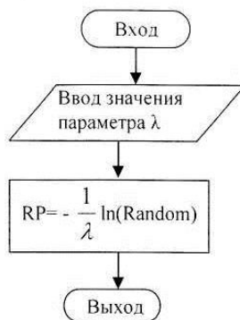
Рис. 2.4. Генератор случайных чисел RP(\lambda) , соответствующий показательному закону с параметром \lambda .

Задание 5. Разработать на языке Си++ генератор случайных чисел, возвращающий значение показательно распределенной случайной величины с параметром \lambda .