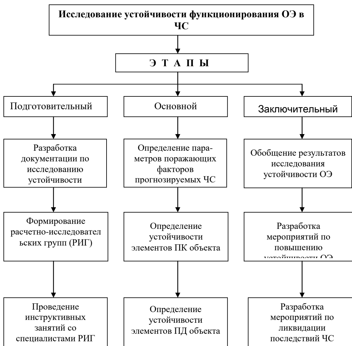
Рис. 1. Схема организации исследования устойчивости функционирования объектов экономики в ЧС