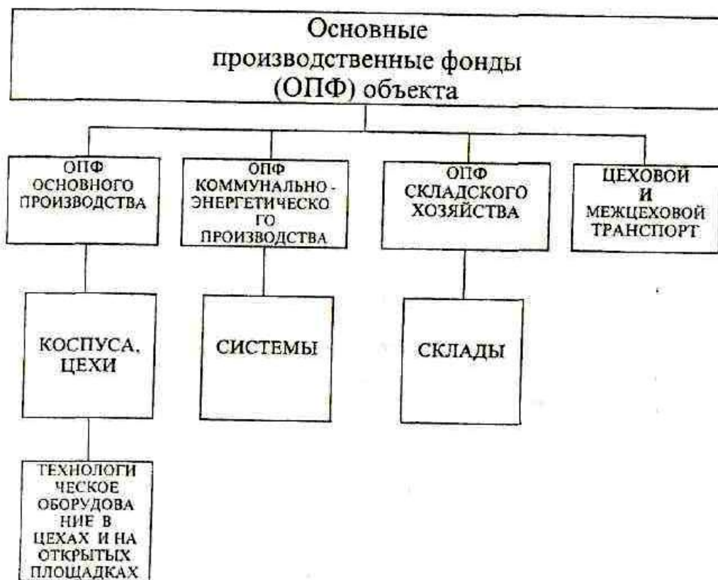
СХЕМА основных производственных фондов (ОПФ)