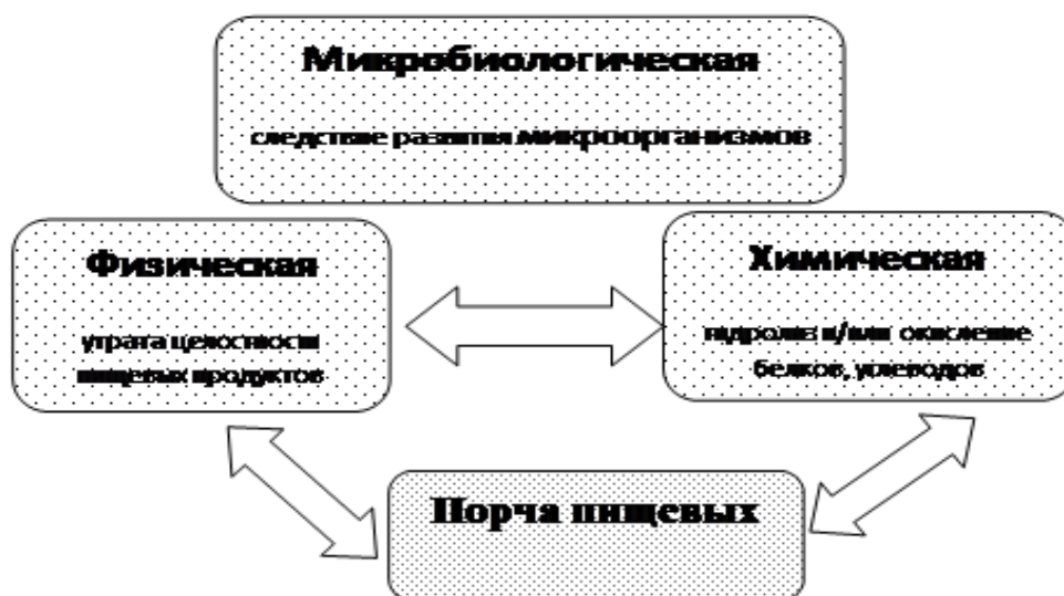
Рис. 2. Виды порчи пищевых продуктов

Микробиологическая порча наиболее опасная для человека из-за выделяющихся токсинов и развития болезнетворной микрофлоры.