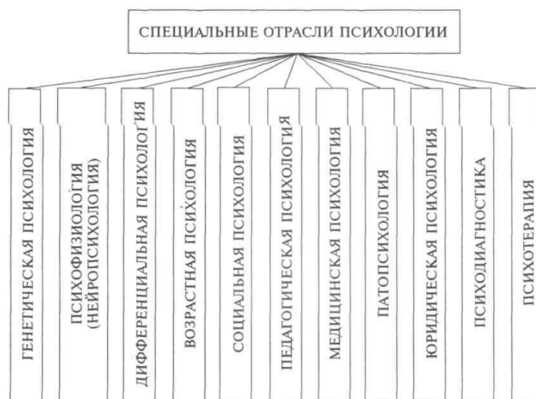
Рис. 3. Отрасли психологической науки, имеющие отношение к обучению и воспитанию

Социальная психология изучает человеческие взаимоотношения, явления, возникающие в процессе общения и взаимодействия людей друг с другом в разного рода группах, в частности в семье, школе, в ученическом и педагогическом коллективах. Такие знания необходимы для психологически правильной организации воспитания.